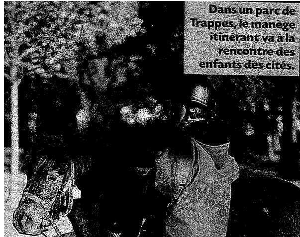
Dans un parc de Trappes, le manege itinérant va à la rencontre des enfants des cités.

Texte : Julie Garner