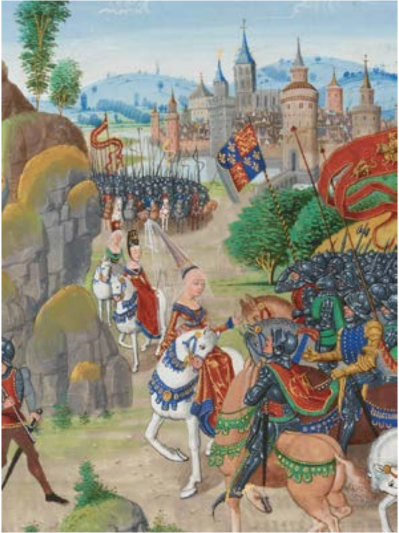
Enluminure extraites des Chroniques sire Jehan Froissart , xiv e -xv e siècles. Elles retracent les conflits qui opposent la France et l'Angleterre entre 1327 et 1400.