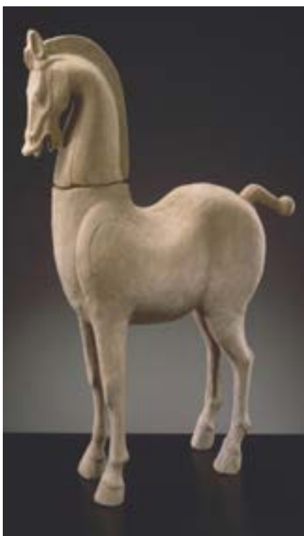
Statue de cheval, dynastie des Han, 25-200 av. J.-C., musée Guimet, Paris.

A-t-il commencé par tirer les chariots ou par servir de monture?