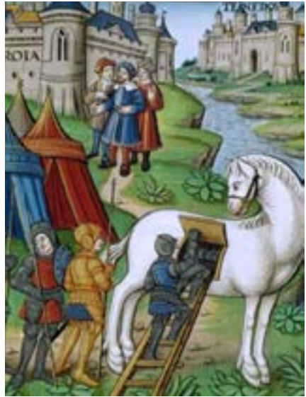
L'armée grecque se camouflant dans le cheval de Troie, L'Énéide , illustration du XVI e siècle, Paris, Bnf.

Il est donc bien naturel que l'on retrouve notre animal en bonne place dans la mythologie aux côtés de Poséidon, dieu des chevaux et père du plus célèbre d'entre eux, Pégase aux ailes d'oiseau.