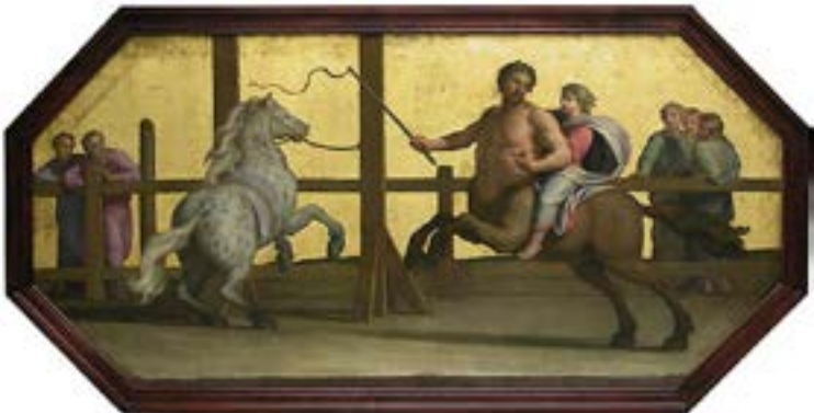
Jean-Baptiste de Champaigne, L'Éducation d'Achille, la leçon d'équitation , XII e siècle, Paris, musée du Louvre.

Pour les peuples sédentaires de l'Antiquité, le cheval n'a guère finalement qu'une utilité limitée : faute d'attelage efficace, on lui épargne les travaux agricoles pour l'envoyer plutôt sur les champs de bataille ou à la chasse.