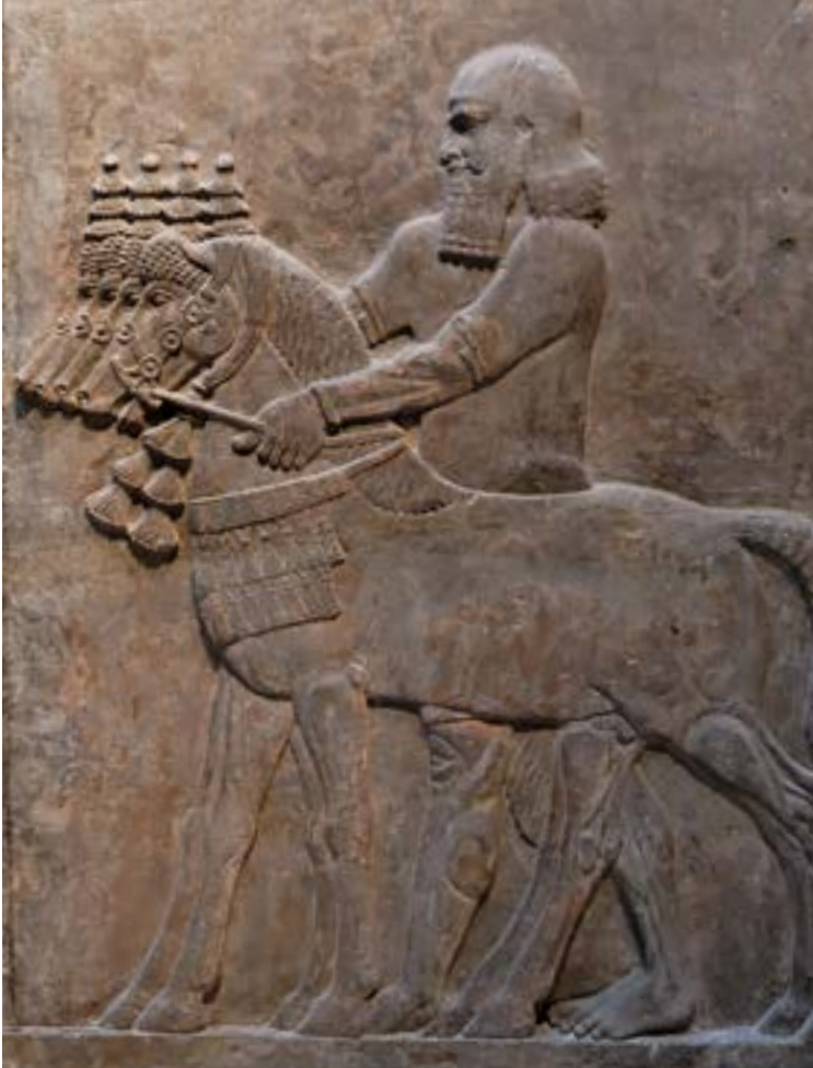
Écuyer conduisant des chevaux, bas-relief du palais de Khorsabad, Assyrie, XIII e av. J.C.

Mais rien ne pouvait arrêter ces éleveurs nomades qui semblaient être nés à cheval, à l'exemple de leurs cousins russes les Sarmates, inspirateurs de la légende des terribles Amazones.