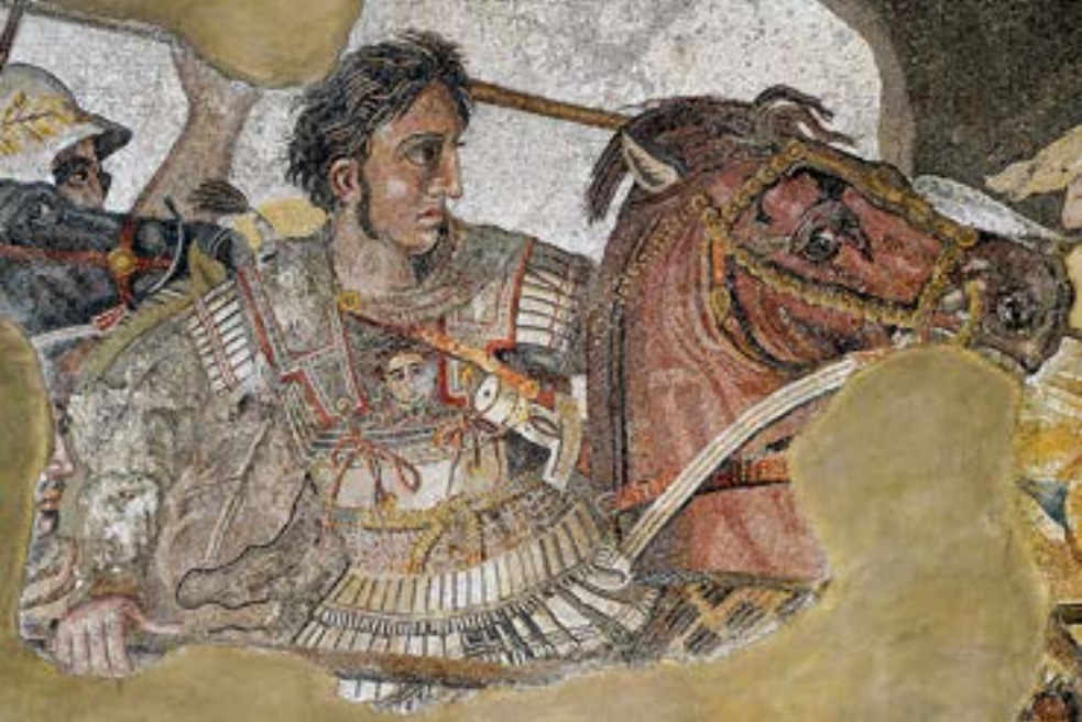
Alexandre et Darius III à Issos, mosaïque, maison du Faune à Pompéi, musée archéologique national, Naples.

de colère, il le flatta doucement de la voix et de la main ; ensuite, laissant couler son manteau à terre, il s'élança d'un saut léger, et l'enfourche en maître. D'abord il se contente de lui tenir la bride haute, sans le frapper ni le harceler ; mais, sitôt qu'il s'aperçoit que le cheval a rabattu de ses menaces et qu'il ne demande plus qu'à courir, alors il baisse la main, et le lâche à toute bride, en lui parlant d'une voix plus rude et en le frappant du talon. Philippe et tous les assistants regardaient d'abord avec une inquiétude mortelle, et dans un profond silence ; mais, quand Alexandre tourna bride, sans embarras, et revint la tête haute et tout fier de son exploit, tous les spectateurs le couvrirent de leurs applaudissements. Quant au père, il en versa, dit-on, des larmes de joie ; et, lorsque Alexandre fut descendu de cheval, il le baisa au front : "Ô mon fils ! dit-il, cherche un royaume qui soit digne de toi ; la Macédoine n'est pas à ta mesure." »