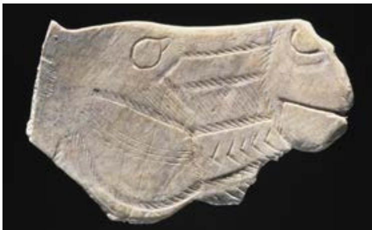
Tête de cheval en contour découpé, 14 000 av. J.-C., Saint-Germain-en-Laye, musée d'Archéologie nationale.

plus lointains, apparus il y a quelque 50 millions d'années, ne dépassaient pas en effet la taille d'un chien et possédaient des pieds griffus qui le handicapaient en cas de fuite.