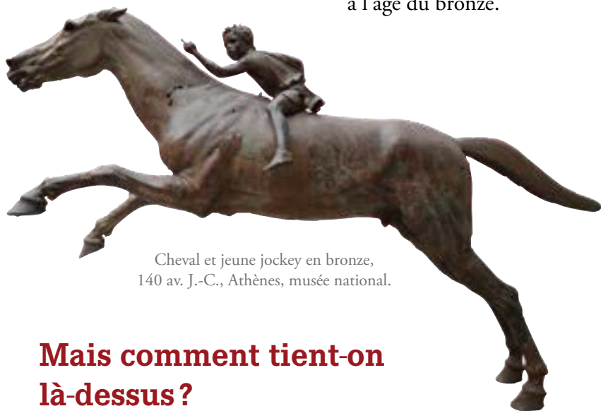
Cheval et jeune jockey en bronze, 140 av. J.-C., Athènes, musée national.

Le débat n'est pas clos, mais il est certain que cela n'a pu se faire sans le développement des technologies nécessaires, à l'âge du bronze.